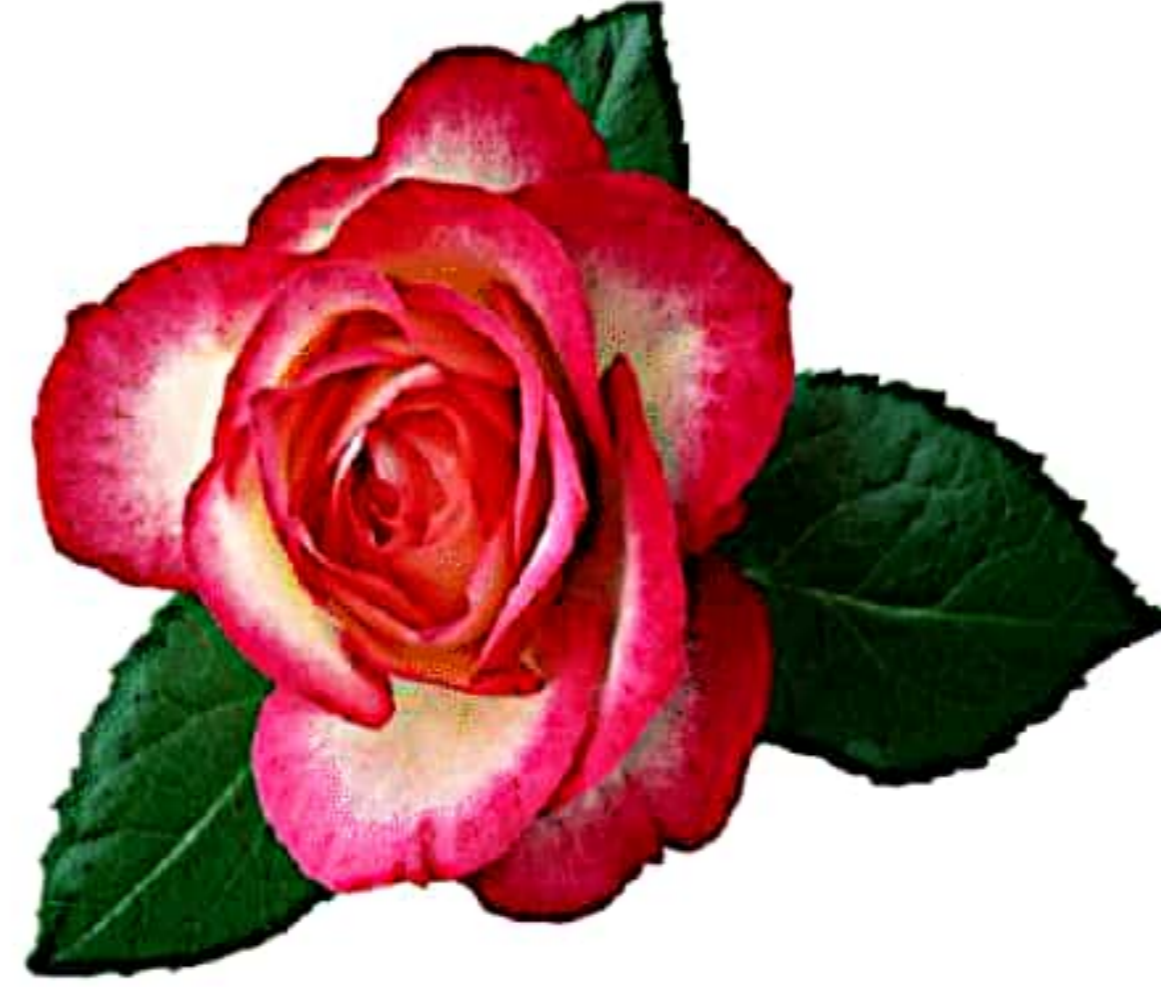
(ग) एक फूल